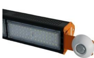
zij-aanzicht met sensor

De volledige ontwikkeling en productie van dit product vindt plaats in Duitsland. Dit product draagt met recht het predikaat „Made in Germany“ en garandeert daarmee korte levertijden.